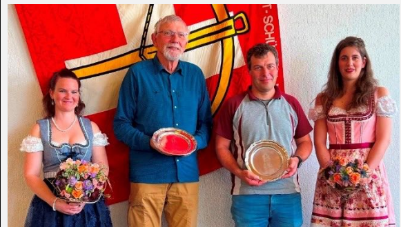
Die Vereine Bucheggberg und Grächen feiern je ihren 25. Geburtstag.

den konnte, die Zustimmung der Delegierten.