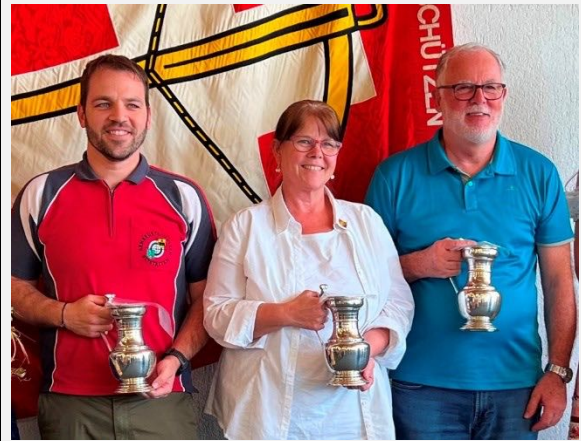
Sie feiern 2025 ihr 75jähriges Bestehen: Altstätten, Thunstetten und Oberengstringen (vlnr).