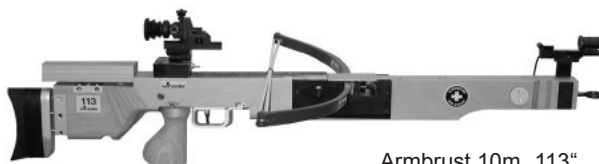
Armbrust 10m „113“