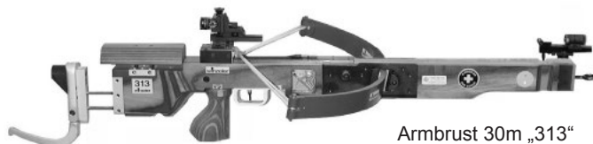
Armbrust 30m „313“